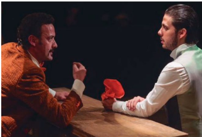
Dios, o no ser