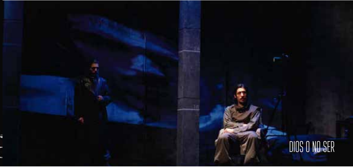
DIOS O NO SER